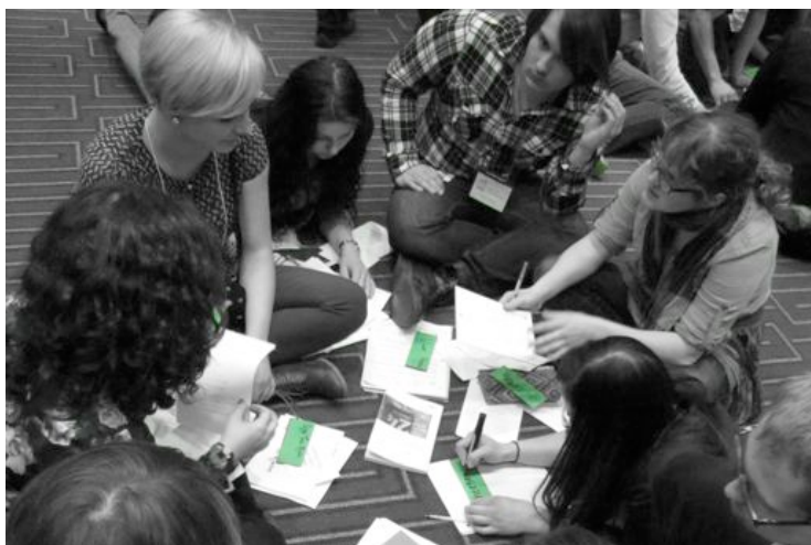
Un moment des délibérations du Prix littéraire des collégiens 2014

– Notre esprit contient tous les mondes possibles, dit-elle, sauf celui dans lequel nous vivons. [...]