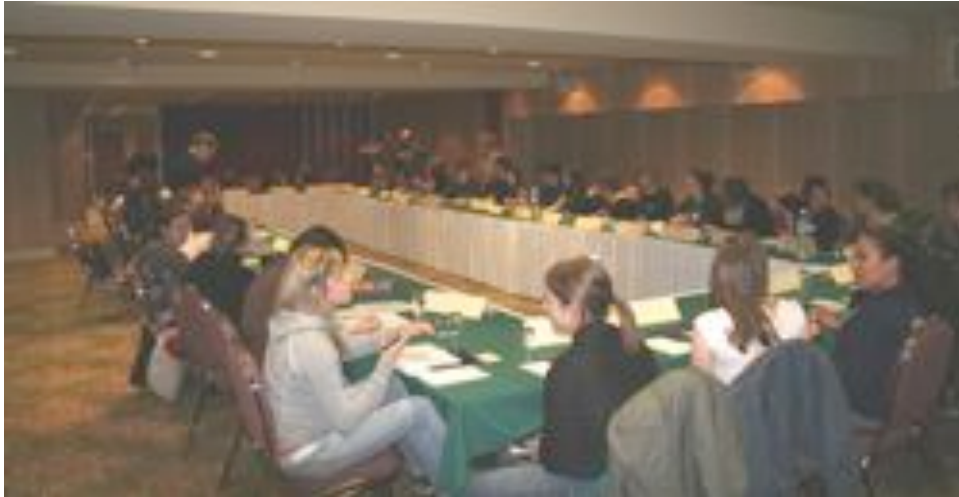
Délibérations nationales à Québec