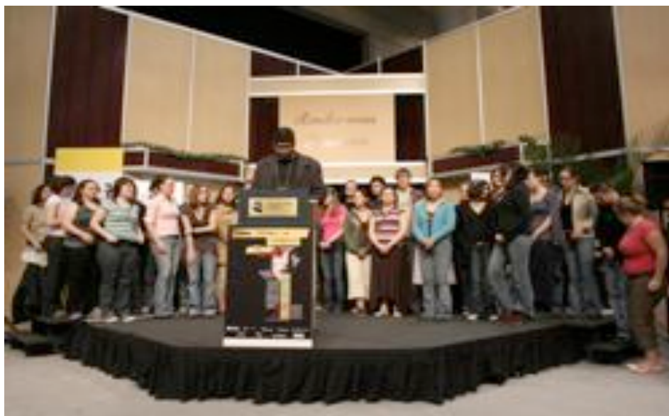
Remise du Prix littéraire des collégiens au Salon International du livre de Québec